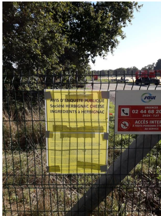
A l'entrée de la station d'épuration